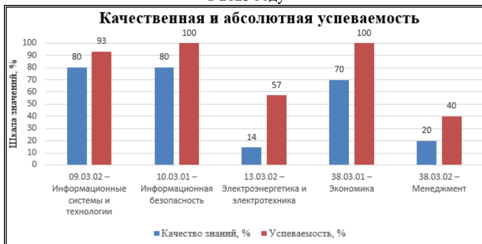
Рис. 5. Результаты участия обучающихся АГУ им. В.Н. Татищева в проекте Рособрнадзора по независимой оценке качества образования в 2023 году

За 2023 календарный год получено около 700 результатов тестирования. Результаты проведенного тестирования позволяют говорить о том, что успеваемость и качество знаний по дисциплинам, в рамках которых проводился входной контроль знаний первокурсников, на низком уровне; а по дисциплинам, формируемым компетенции в университете, успеваемость на высоком уровне (81 %), качество знаний на среднем уровне (58 %).