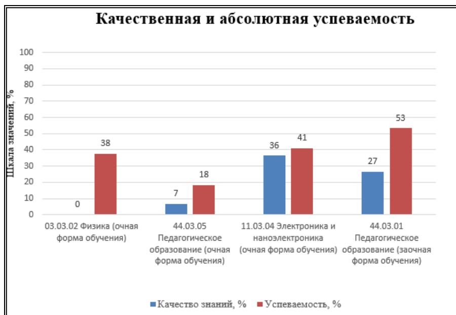
Рис. 2. Результаты участия обучающихся АГУ им. В.Н. Татищева во входном контроле по математике за 2023 календарный год