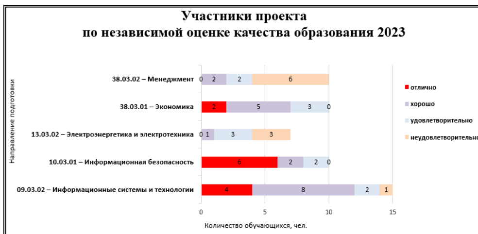
Рис. 4. Участники проекта Рособрнадзора по независимой оценке качества образования в 2023 году

В АГУ им. В.Н. Татищева в 2023 году в данном мероприятии приняло участие 52 обучающихся пяти направлений подготовки программ бакалавриата. Анализ результатов тестирования показал достаточно высокий уровень успеваемости у обучающихся по дисциплинам, в рамках которых формировались общепрофессиональные компетенции (рис. 4, рис. 5).