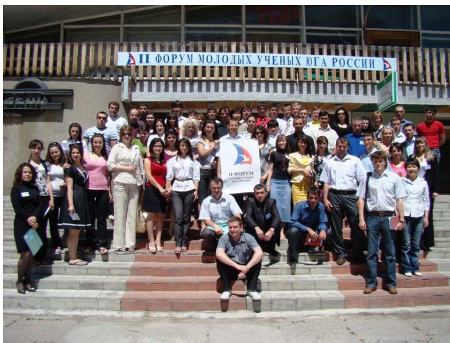
Участники II Форума молодых ученых Юга России (Россия, Кабардино-Балкарская республика, 15–18 июля 2008 г.).

Организаторами данного мероприятия выступили Кабардино-Балкарское региональное отделение Российского союза молодых ученых при участии Астраханского, Карачаево-Черкесского, Краснодарского, Ростовского, Ставропольского и Чеченского региональных отделений Российского союза молодых ученых. Форум проводился при поддержке Федерального агентства по делам молодежи и Государственного комитета Кабардино-Балкарской Республики по делам молодежи и общественных объединений. Мероприятие собрало около 100 молодых ученых, представлявших разные регионы Южного федерального округа.