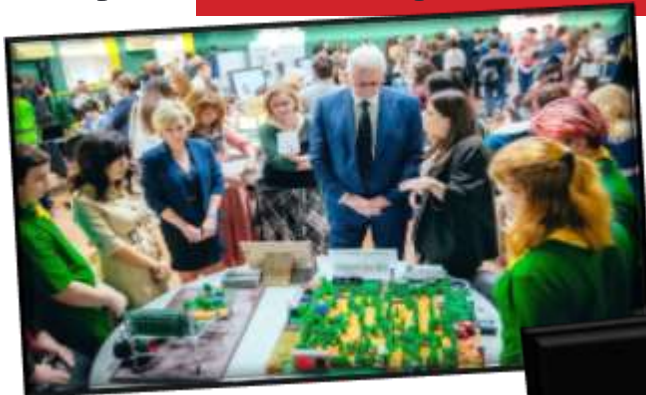
Презентация студенческих проектов – лабиринт из зеленых растений