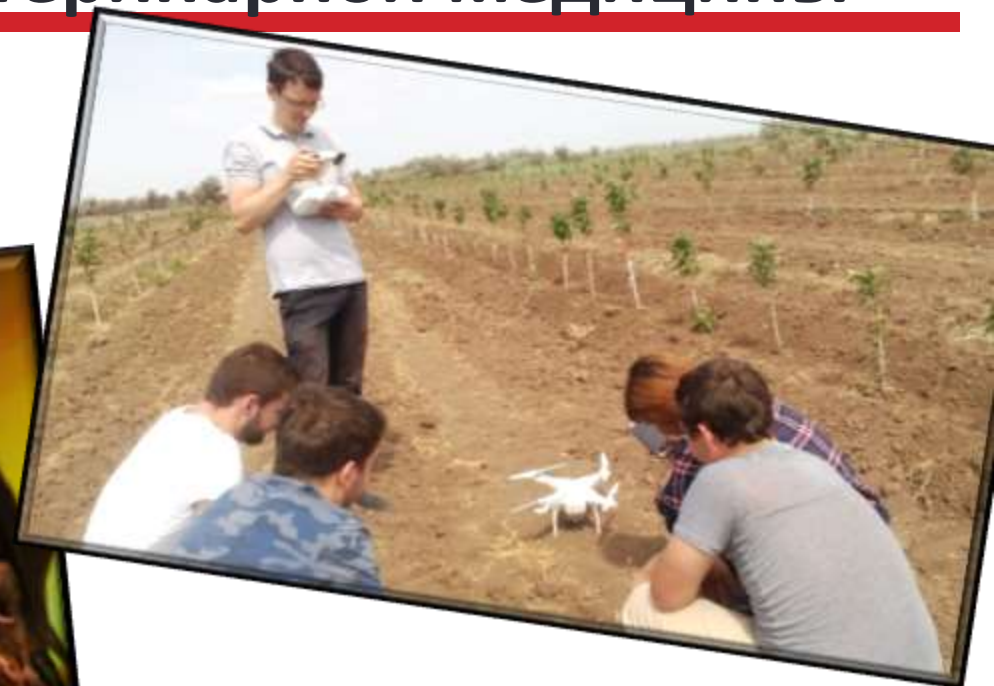
Работа в поле