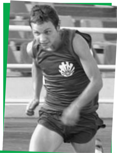
НАШИ на универсиаде