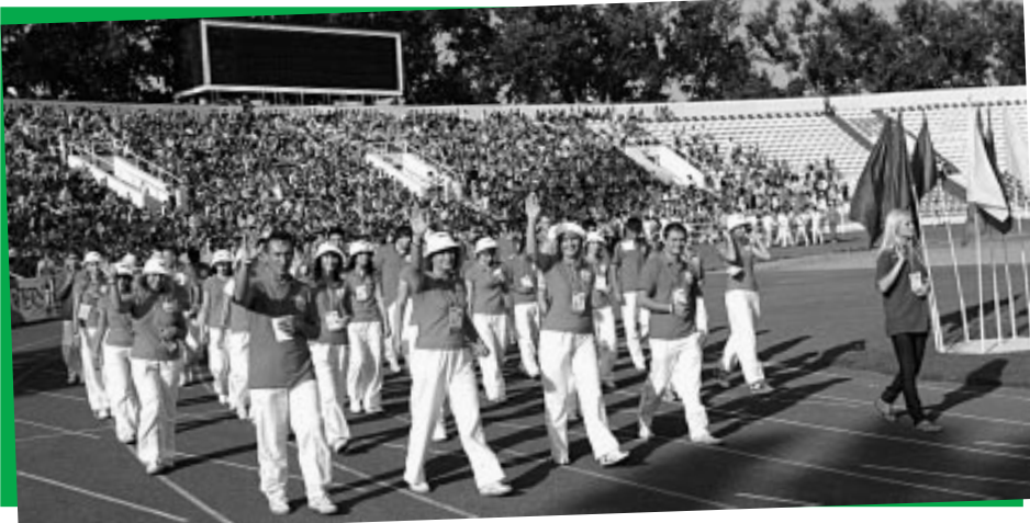
Команду АГУ ректорат одел с ног до головы