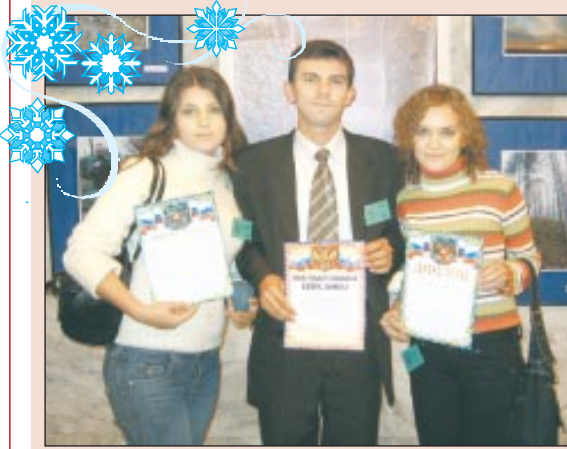
Они вернулись с победой

Команда АГУ успешно показала себя на III туре Всероссийской студенческой олимпиады по специальности «Социальная работа».